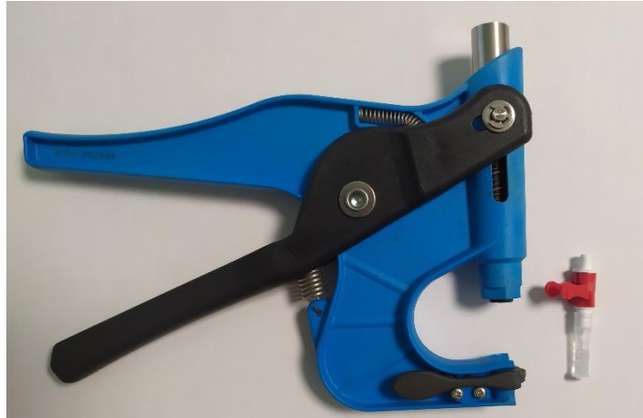
Matériel de prélèvement

vosre élevage ou lors d'un achat (si bien sûr la recherche n'a pas déjà été effectuée par un détenteur précédent). S'assurer que l'ensemble des taureaux d'un cheptel ne sont pas porteurs de la maladie c'est la garantie de ne pas avoir de veaux symptomatique et cela quel que soit le statut des vaches, porteuses ou non.